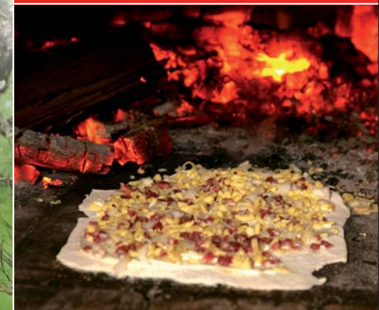
Elsässer Flammkuchen aus dem Backhaus