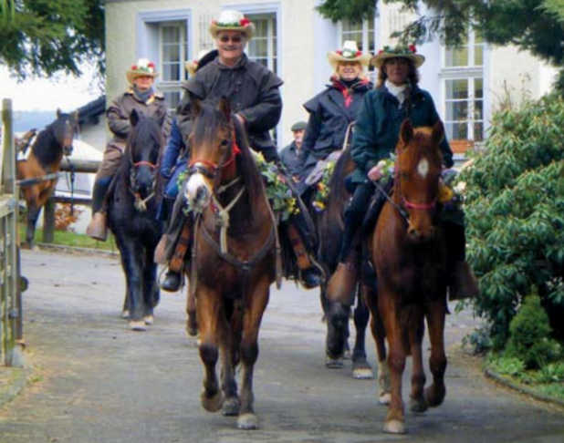
Die Frühlingsreiter eröffnen die Wanderreiter-Saison 2009