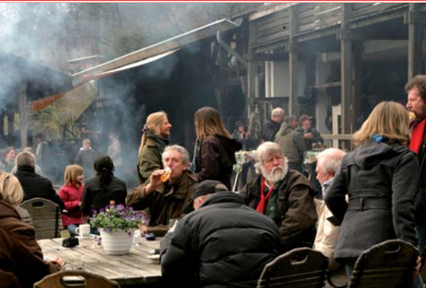
Trinken, lachen, wiedersehen, kennenlernen, Pläne schmieden